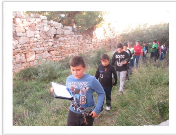
Tres castells: Morella, Peníscola i Sagunt